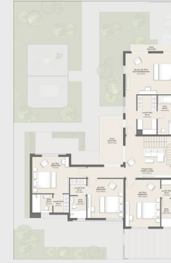
الطابق الأول FIRST FLOOR