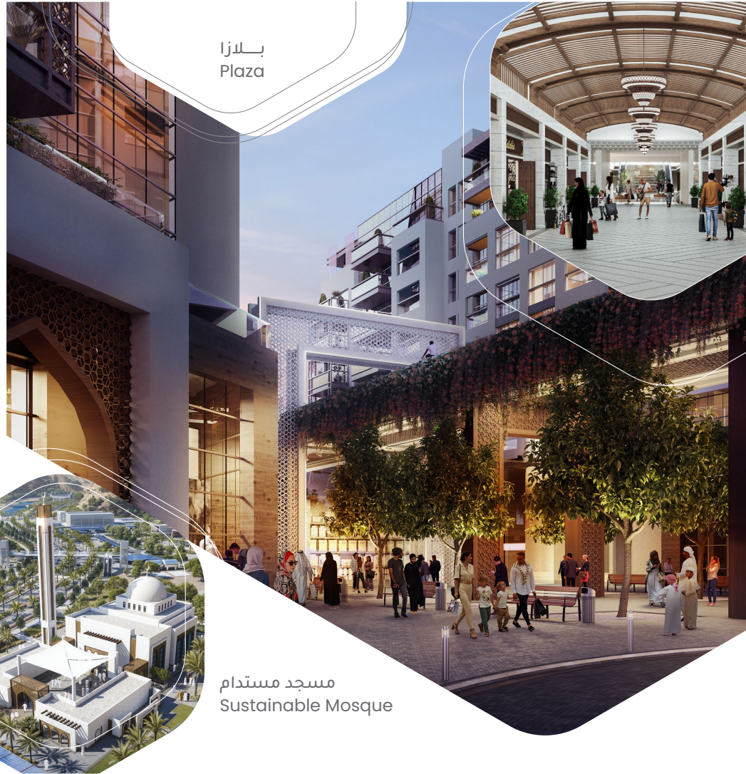
مسجد مستدام Sustainable Mosque