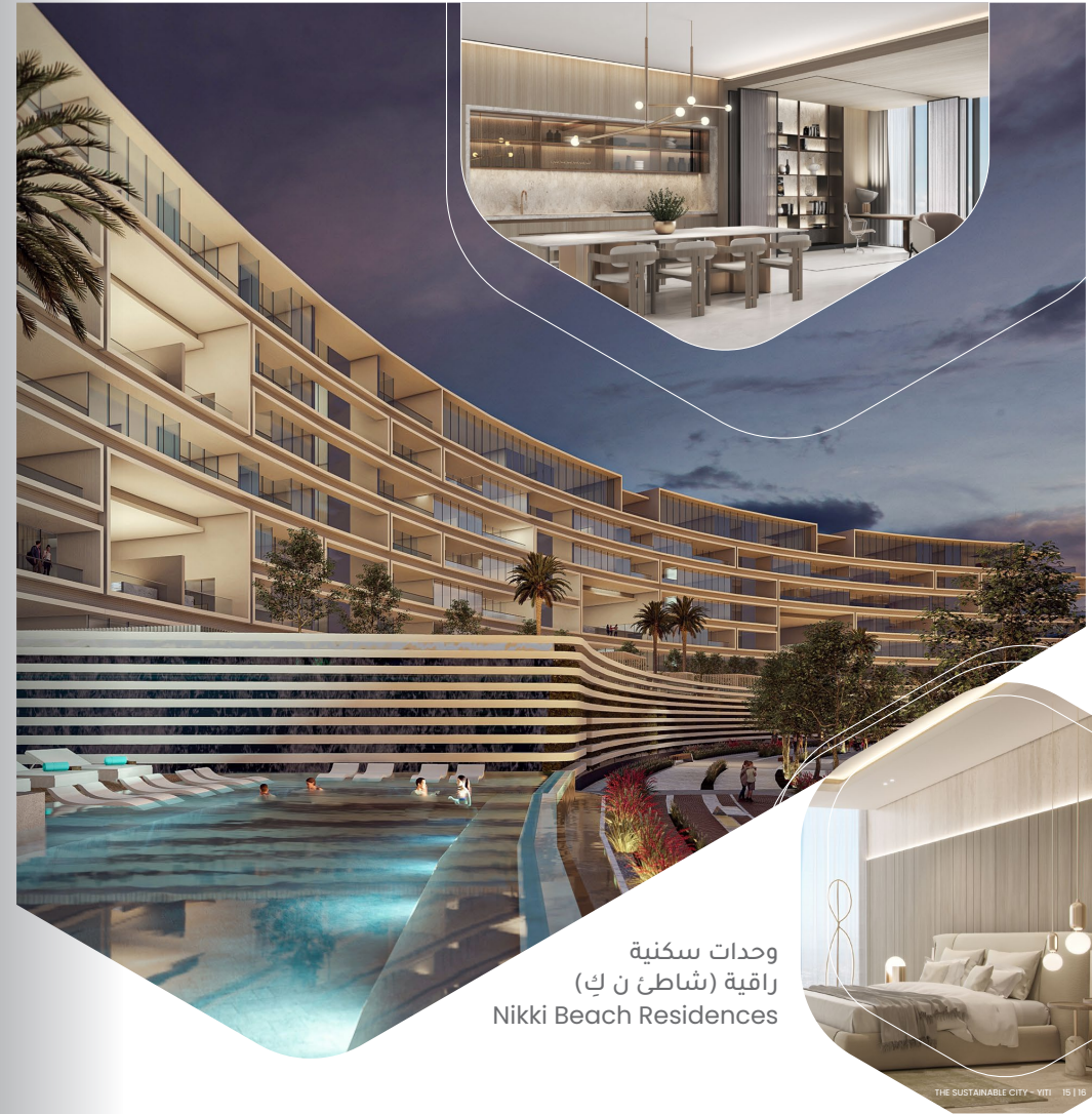
وحدات سكنية راقية (شاطئ ن ك) Nikki Beach Residences