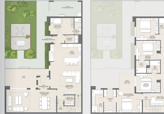
الطابق الأرضي GROUND FLOOR