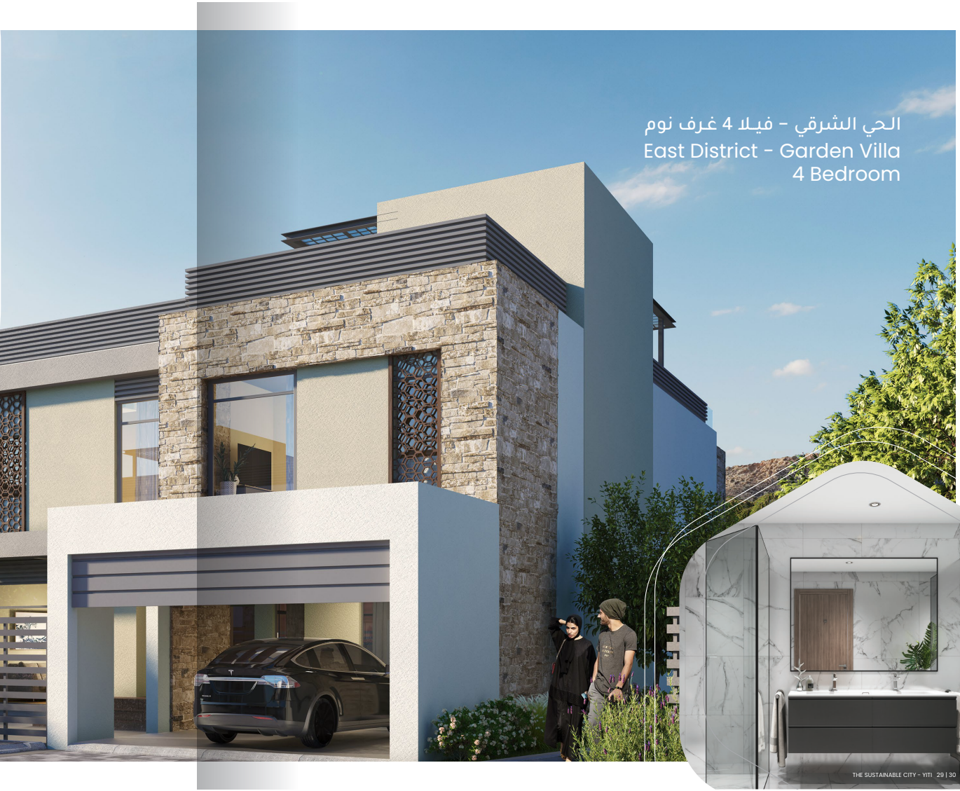
الحي الشرقي - فيلا 4 غرف نوم East District - Garden Villa 4 Bedroom