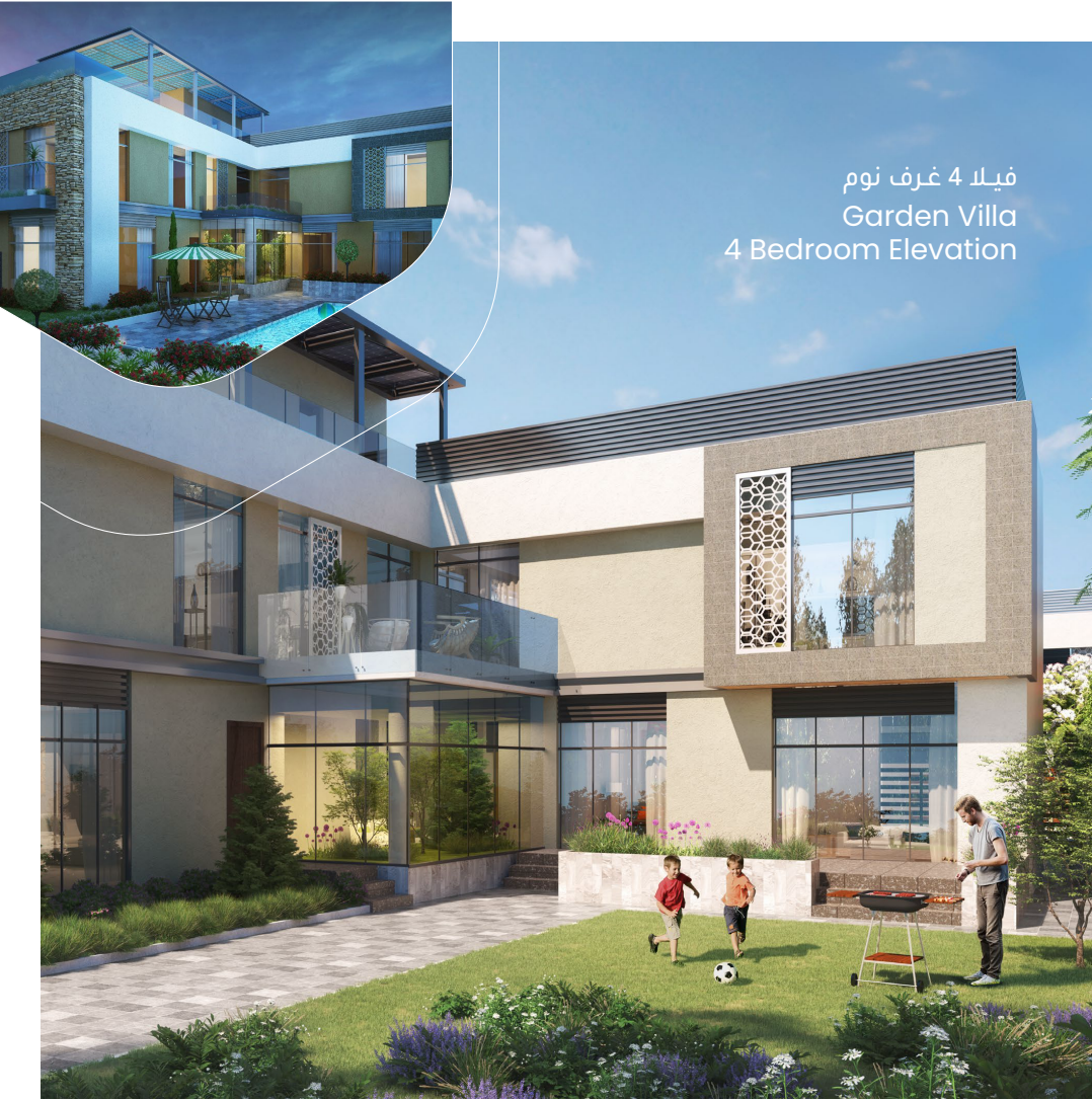
فيلا 4 غرف نوم Garden Villa 4 Bedroom Elevation