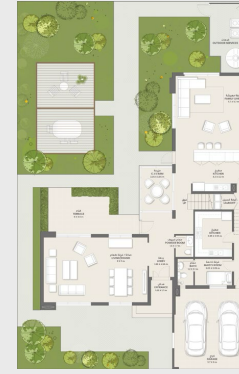
الطابق الأرضي GROUND FLOOR