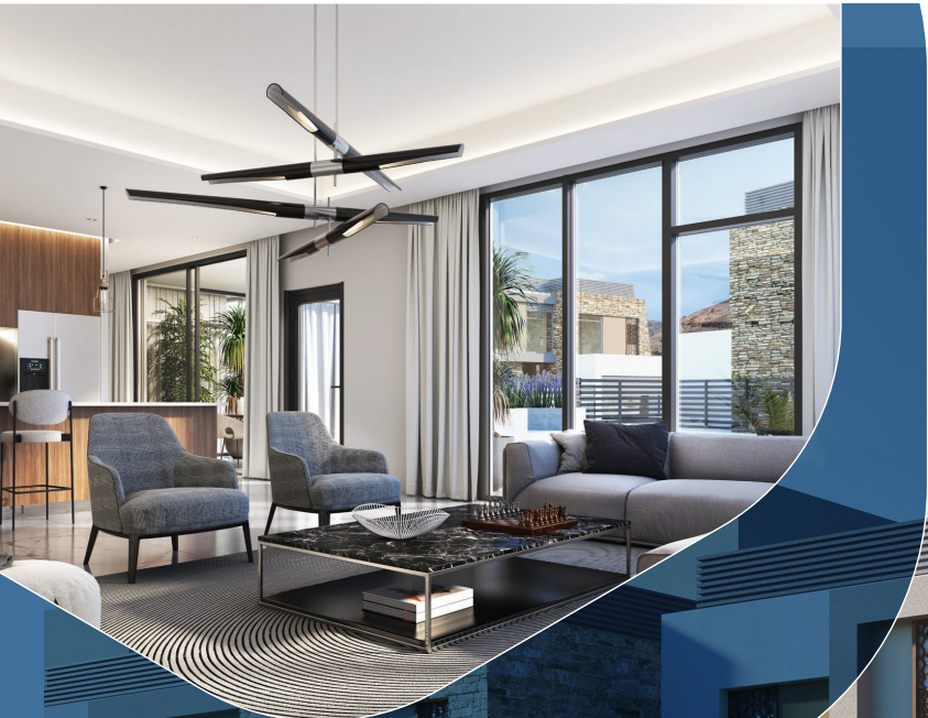
الحي المستدام - الشرق Sustainable District (SD) East