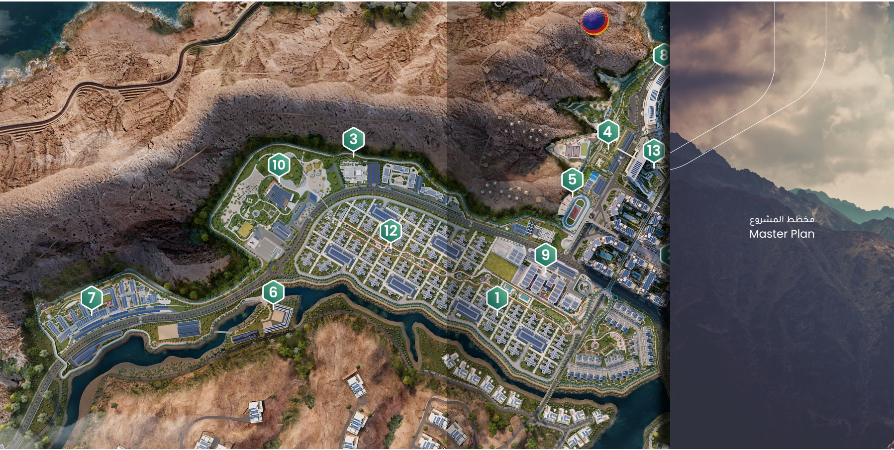
مخطط المشروع Master Plan